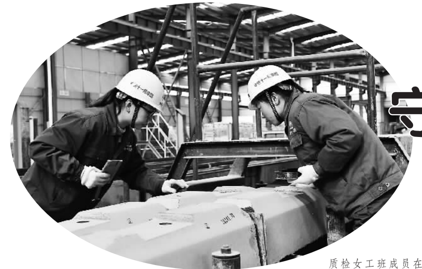
质检女工班成员在测量。

据是女性会过日子的象征,也是“雪莲号”女工成本管理的一大特点。她们的口号是“没有最抠,只有更抠”,在点点滴滴的细节中“抠”效益,在耗水、耗电、耗材等方面保持全厂最低成本。她们将一块用来擦拭设备的大布撕成10小块,反复清洗使用,每人每月可“抠”回两块大布。