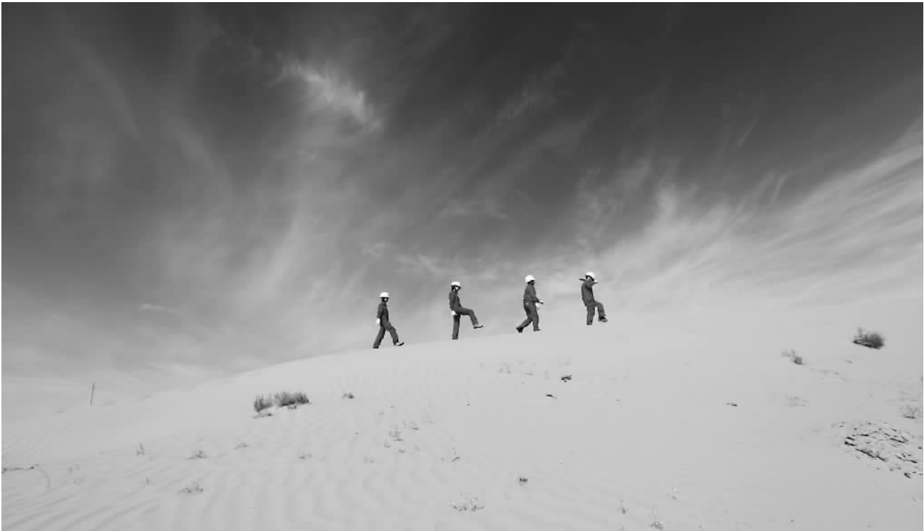
为管理30多口油井,“雪莲号”的姐妹们要翻越几座沙丘。

每月保养站内近百个阀门是女工最辛苦的工作之一。她们反复琢磨,如果在狭小空间不拆手轮,让润滑脂送到最顶端,就可以省时省力还省费用。一天,一个女工发烧输液,陪护的女工灵光一现:“我们可以用针管注射润滑脂,这样既均匀又能全方位保养。”就这样,“给阀门打针”的保养法诞生