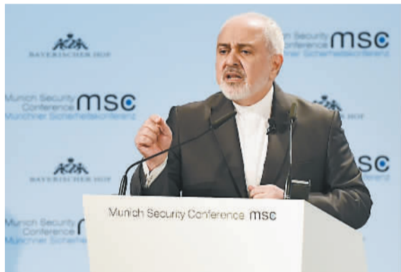
这是2月17日,伊朗外交部长扎里夫在德国慕尼黑安全会议上发言的资料照片。

伊核协议,并重启对伊制裁。为维持伊核协议,扎里夫一方面与西方国家接触周旋,另一方面也不断向美国的反伊行为示强。但是随着伊朗国内经济状况恶化,强硬派逐渐得势,频频攻击鲁哈尼政府对西方让步,扎里夫本人也差点遭弹劾。