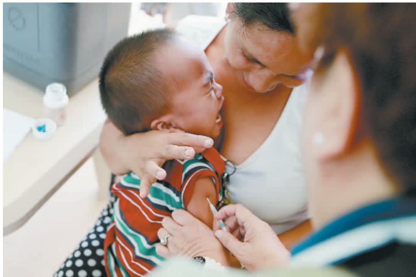
2月16日,在菲律宾马尼拉,医务工作者为一儿童接种免费麻疹疫苗。