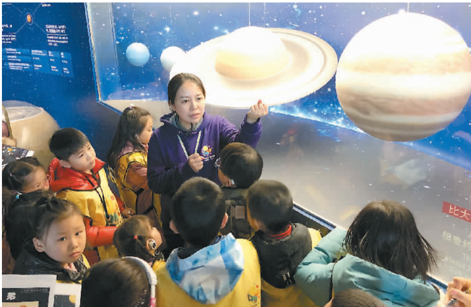
2月20日,随着最近上映的科幻大片《流浪地球》热映,引来众多天文爱好者前来“打卡”,感受天文科技魅力。图为北京天文馆里讲解员正在给前来参观的小朋友讲解木星的知识。

“这样一步步,让我们所接触的合作伙伴可以看到一个关于电影大致的雏形,从而慢慢建立起信心。大家可以看到片尾字幕,我们的团队最后达到了7000多人。”这个过程中,导演郭帆心里也越来越有底了。