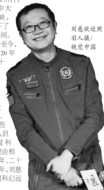
刘慈欣近照

从《鲸歌》至今,刘慈欣用了20年(其实自有前十年是创作高峰),将自己的名字镌刻在了中国文学史上,也让诸如奥巴马、扎克伯格这些外籍人士从认识到喜欢中国科幻。我们有理由相信,未来的十年、二十年,甚至三十年,刘慈欣会再让中国科幻远航再远航。