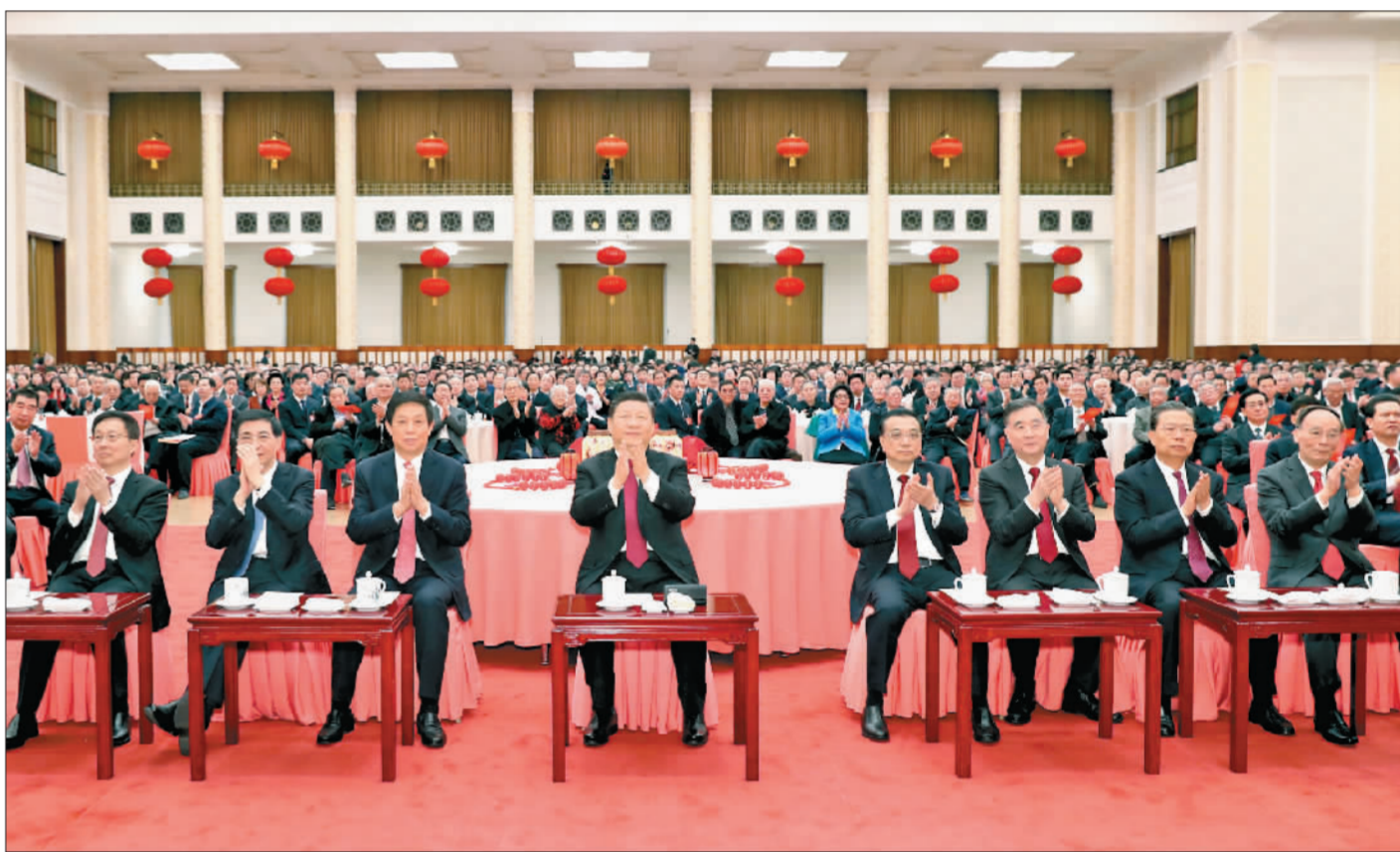
党和国家领导人习近平、李克强、栗战书、汪洋、王沪宁、赵乐际、韩正、王岐山等同首都各界人士欢聚一堂,共迎新春。