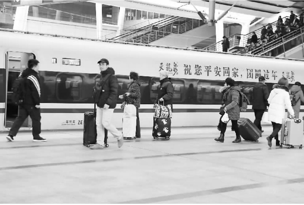
2019年1月24日,北京西站站台,旅客踏上列车。