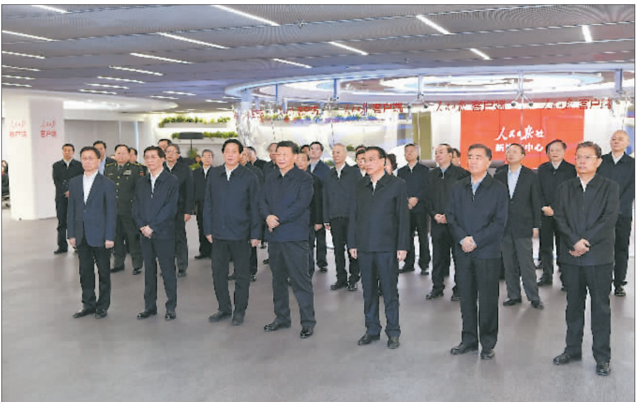
1月25日,中共中央政治局在人民日报社就全媒体时代和媒体融合发展举行第十二次集体学习。这是习近平、李克强、栗战书、汪洋、王沪宁、赵乐际、韩正等在人民日报新媒体中心听取报社微博、微信公众号、客户端建设情况汇报,并观看新媒体产品展示。

新华社北京1月25日电 中共中央政治局1月25日上午就全媒体时代和媒体融合发展举行第十二次集体学习。中共中央总书记习近平在主持学习时强调,推动媒体融合发展,建设全媒体成为我们面临的一项紧迫课题。要运用信息革命成果,推动媒体融合向纵深发展,做大做强主流舆论,巩固全党全国人民团结奋斗的共同思想基础,为实现“两个一百年”奋斗目标、实现中华民族伟大复兴的中国梦提供强大精神力量和舆论支持。 这次中央政治局集体学习把“课堂”设在了媒体融合发展的第一线,采取调研、讲解、讨论相结合的形式进行。 25日上午,在习近平带领下,中共中央政治局同志来到人民日报社新媒体大厦。他们首先在人民日报数字传播公司现场察看和了解电子阅报栏建设和推广应用情况。得知这样的数字化终端集成了浏览新闻、开展思想政治学习、提供图书期刊借阅等功能,已成为重要融合传播平台,习近平表示肯定,强调电子阅报栏是媒体传播的一种重要创新。要不断总结经验,在理念思路、体制机制、方式方法上继续探索,在向基层拓展、向楼宇延伸、向群众靠近上继续下功夫,为人民群众提供更多更好的文化和信息服务,让人民日报离人民更近,做到人民日报为人民。 采编发流程再造和融媒体中心建设是媒体融合发展的重要一环。习近平等来到人民日报“中央厨房”,结合视频短片了解打通“报、网、端、微、屏”各种资源、实现全媒体传播情况。习近平同“麻辣财经”、“一本正经”、“侠客岛”、“学习大国”等工作室采编人员亲切交谈。习近平指出,党报、党刊、党台、党网等主流媒体必须紧跟时代,大胆运用新技术、新机制、新模式,加快融合发展步伐,实现宣传效果的最大化和最优化。 在移动报道指挥平台前,习近平同正在河北省承德市滦平县平坊满族乡于营村采访的记者和扶贫驻村第一书记连线交流,了解该村脱贫攻坚工作进展情况。习近平强调,脱贫攻坚是一项历史性工程,是中国共产党对人民作出的庄严承诺。我们党最讲认真,言必行、行必果,说到做到。他希望广大