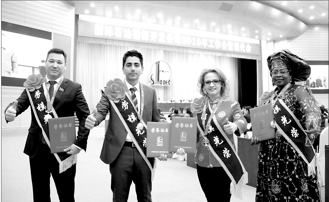
“洋劳模”登上颁奖台

工人阶级的历史主动精神,在深化改革、推动发展、促进和谐进程中,勤奋劳动、诚实劳动、创新劳动,更加自觉地投身改革发展的伟大实践。 洛桑久美要求各级工会进一步发挥工会组织职能作用,扎实做好劳模和工匠人才管理服务工作。要为劳动模范、西藏工匠发挥作用搭建平台、提供舞台,为劳模、工匠传承技能、传承精神创造条件,培养造就更多劳动模范、西藏工匠。要进一步探索和完善培养劳模、选树劳模、表彰劳模、关心劳模的工作机制,认真落实劳模待遇,切实帮助他们解决生产生活中的困难和问题,在全社会推动形成尊重劳模、关爱劳模的良好社会风尚。