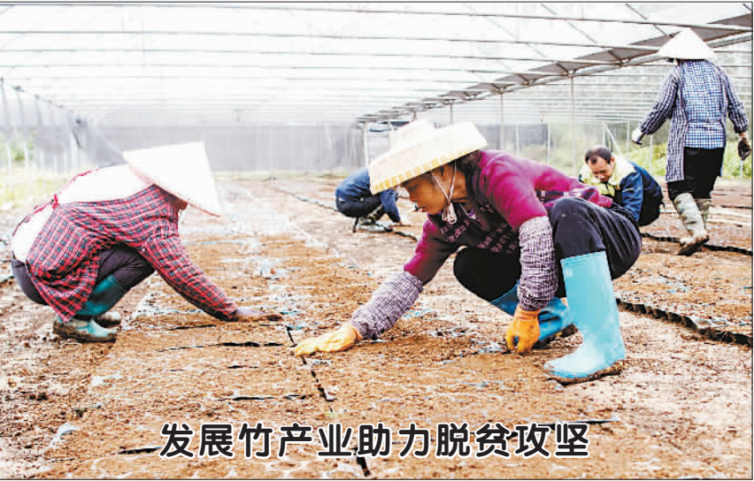
——发展竹产业助力脱贫攻坚

在钦州市钦北区那蒙镇竹山村，农民铺设竹苗育床(1月6日摄)。 近年来，广西积极推行“公司+基地+合作社+种植户”模式，企村联动种植培育竹