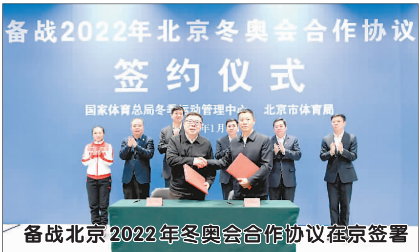
备战北京2022年冬奥会合作协议在京签署

在支出限额上,中乙俱乐部今后3年均应为0.35亿元,中甲俱乐部为2亿元。在人工成本方面,中乙俱乐部将不得超过65%,中甲俱乐部逐年下降,到2021年为55%。此外,在投资人注资限额、奖金限额、亏损限额上也给出了硬性指标。这将在一定程度上缓解中甲中乙足球俱乐部的运营压力,但这些俱乐部能否增加自身造血功能广开财源,仍有待检验。