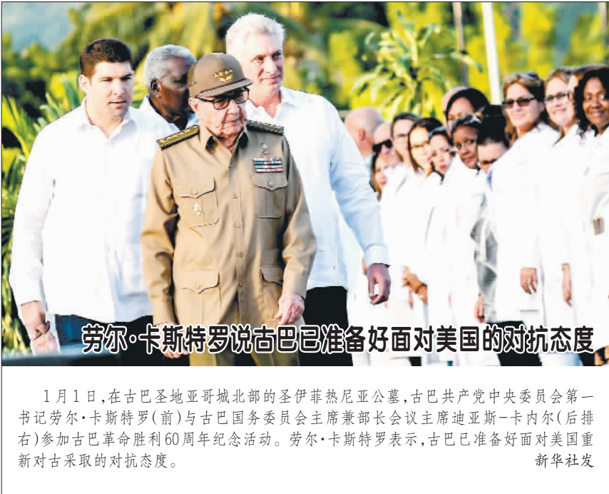
劳尔·卡斯特罗说古巴已准备好面对美国的对抗态度

分析人士说,欧元未来发展仍面临先天结构性缺陷,改革缓慢,欧元区内部“贫富分化”等制约因素。