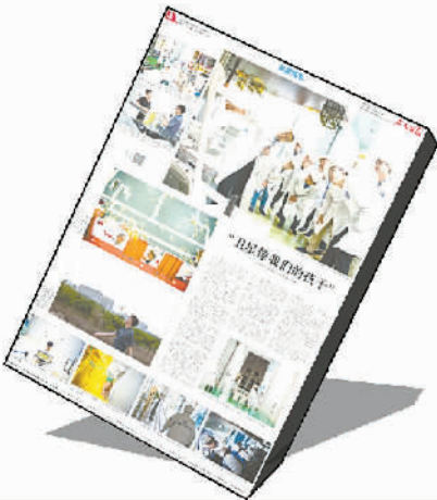
5月27日《“卫星”像我们的孩子》