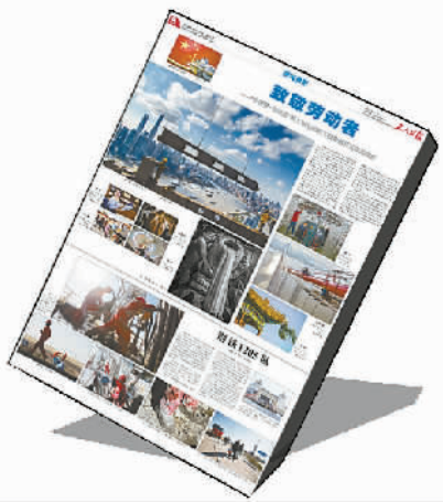
10月19日《致敬劳动者》《钢铁1205队》