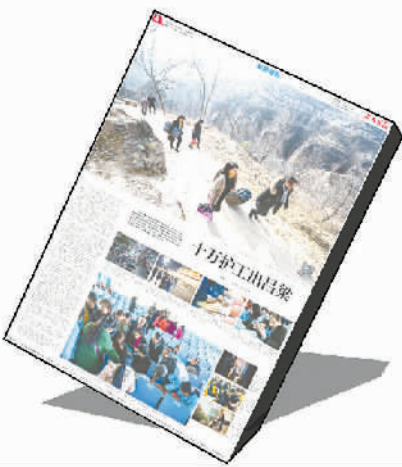
1月14日《十万护工出吕梁》