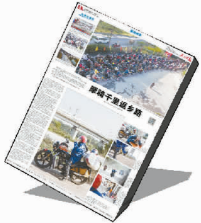
2月12日《摩骑千里返乡路》