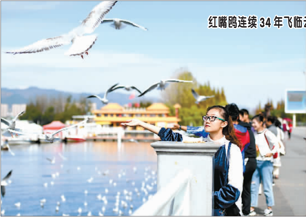
红嘴鸥连续 34 年飞临云南昆明越冬