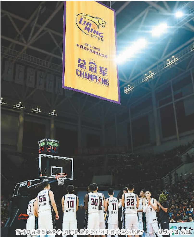
面对日益激烈的竞争,辽宁队能否让总冠军旗帜再次升起?