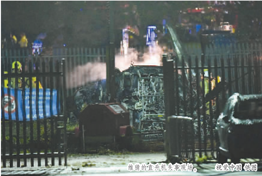
维猜的直升机失事现场。

“我们怀着沉重的心情,非常遗憾地确认,我们的主席维猜·斯里瓦塔那布拉帕已经在星期六晚上的直升机坠毁事件中丧生,机上5人无人生还。”