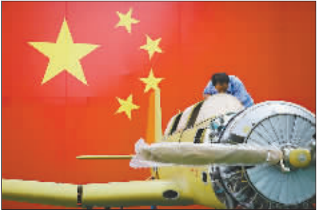
优秀奖《报国强军》