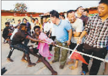
铜奖 《外国工友》(组照)