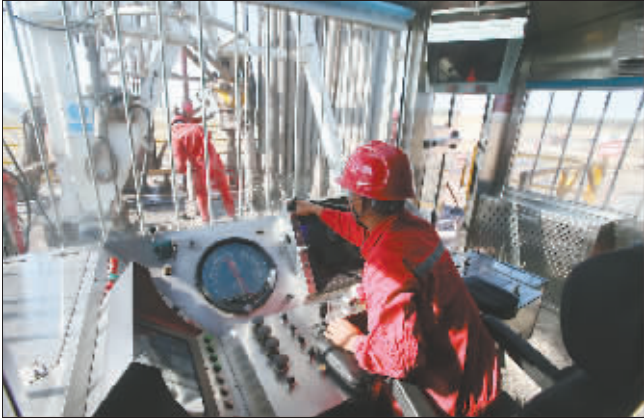
先进技术的运用,极大地提高了生产效率。