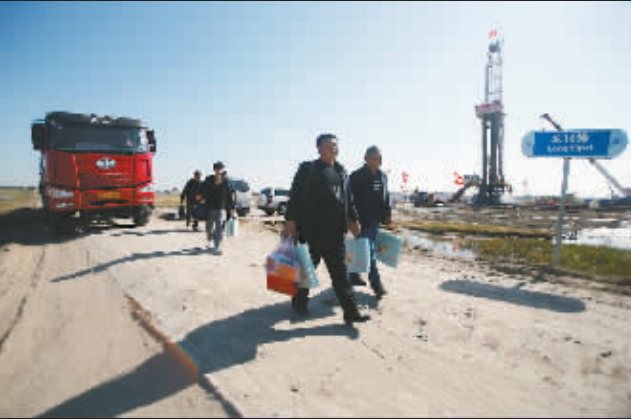
9月20日下班后,拿着井队发的过节礼物准备拼车回家的工人。