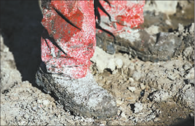
在工作现场,几乎每个人的鞋上都沾满了厚厚的泥浆。