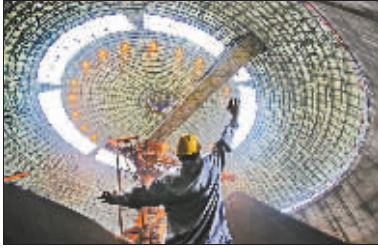
银奖 《钢铁臂膀》