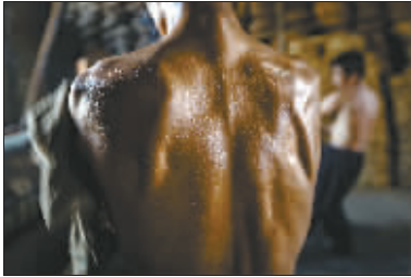
优秀奖 《传统木榨油坊》(组照)