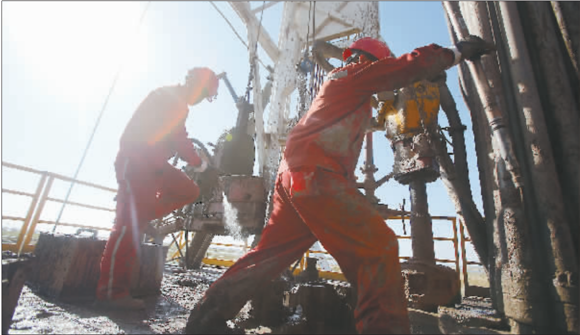
9月20日,1205钻井队的工人们加紧施工,为第四次突破10万米记录进行冲刺。

9月20日,黑龙江大庆市杜尔伯特县,大庆采油九厂井龙十九区块,在这个距离市区两个多小时的荒野之地,散布着星星点点的抽油机。一座井架高高耸立,四周放养的奶牛在悠闲地吃草,初秋的黑土地处处洋溢着丰收的景象。井场门口,两面标有“钢铁1205队”的红旗在风中猎猎作响。钻井平台上,发动机轰鸣,1205钻井队的队员们正在紧张作业,整个场面忙碌但有序。 大庆钻探工程公司钻井二公司1205钻井队是铁人王进喜带过的队伍,是铁人精神的发源地,1953年3月诞生于祖国石油工业的摇篮——玉门,一路走来,今年已是第65个年头。 这是一支有着辉煌历史的队伍,如今,