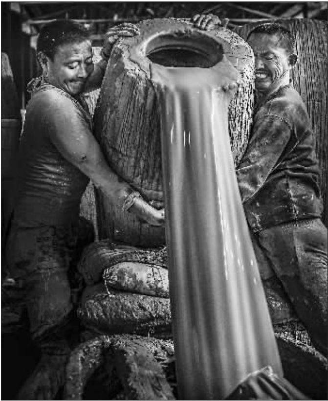
► 优秀奖《陶工》