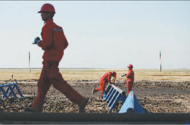
繁忙但有序的井场。