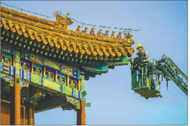
▲铜奖 《空中架桥人》(组照) 余胜亲 摄 铜奖 《我在故宫修故宫》(组照) 胡江桥 摄