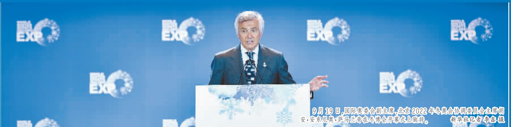
9月19日,国际奥委会副主席、北京2022年冬奥会协调委员会主席胡安·安东尼奥·萨马兰奇在冬博会开幕式上致辞。

冬博会、NHL中国赛北京站等活动密集上演,各方人士就筹办2022年北京冬奥会和发展群众性冰雪运动建言献策——