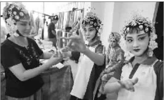
9月6日,在石家庄市深泽县石油工人俱乐部,坠子戏老师(左)指导学生戏曲动作。当日,国家级非遗深泽坠子戏保护成果展演在石家庄市深泽县举行。