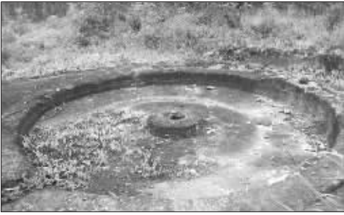
图为一处石屋的俯瞰图。

洞、军事基地、崖墓群。每种说法都有印记。 “弃老洞和军事基地的推断,都是来自于厦门大学一位历史学教授。”忠县文化委负责人告诉记者,石屋群图片被报道后,这位教授首先认为其造型与弃老洞颇有几分相似。据了解,弃老洞是远古时期用于安放那些年满60岁的“负担”老人,洞的面积是如此之小,以致人在洞中只能像虾米一样蜷缩着身体,在洞的底部内测有一个等边三角形石孔,边缘锋利,刚好能容得下一个成人的头颅。石孔是供窑洞中老人自杀用的。“不过,当这位教授亲自前来考察后,又把自己最初的推断否定了,认为石屋群更像是一处军事基地。”这位教授给出的论据是:因为在石屋中,有煮大锅饭的地方,也有储藏弹药的地方,甚至还有两间放炮的石屋,在那里可以看见全部的石屋,足以保证每间的安全。 而在当地文物考古所的研究员眼中,它们是“一个大型崖墓群”。研究员发现,这个崖墓群的墓口处有几个文字,虽然被风化的文字模糊不清,但从轮廓上可以看出应该是汉代的隶书。另外,还有一个墓的规格很高,它的墓室的后壁有四个高浮雕,从形状判断与神兽有关,这四个神兽应该是汉代比较流行的;青龙、白虎、朱雀、玄武。综合以上特征判断,这个崖墓群应该是建成于东汉之六朝,距今已有千余年历史。他们认为,汉代人“事死如生”的习惯,即墓室的设计要按照当时逝者生前的生活场所修建,所以不仅划分了功能间,还修筑有灶台等生活器具,而从石屋群的形态来看,的确符合这样的思路。 不过,截止到目前,关于石屋群身世最终定论还未公布,记者了解到相关部门还在做更进一步考证。忠县文化委的相关负责人表示,目前可以肯定,石屋群是一处珍贵的文物遗址,待考证工作全部结束后,将整理材料进行级别申报。同时,保护工作将持续开展,既然成为当地新的文化旅游观景点,那么就会在文物硬件维护、参观引导等多个方面推出一系列的举措。