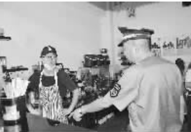
昆明市西山区棕树营街道综合执法队工作人员正在联合执法

游商游贩、私搭乱建、违规停车、食品安全等开展不间断整治,为辖区居民群众营造了良好的生活环境。队伍成立一年多以来,各项工作成效得以显现。