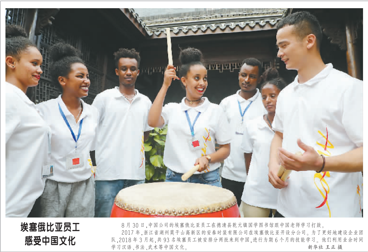
埃塞俄比亚员工在德清县乾元镇国学图书馆跟中国老师学习打鼓。