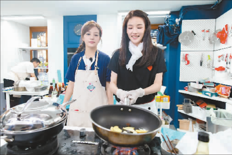
图为《中餐厅 2》中嘉宾舒淇和赵薇。

不同于其他综艺节目，慢综艺中的嘉宾褪去明星光环，过起平凡人的生活。《中餐厅》第二季里，王俊凯不再只是 TF Boys 组合里的“小鲜肉”，扬州炒饭、水煮肉片他都信手拈来。苏有朋不再是《还珠格格》的“五阿哥”，推销菜品、帮顾客策划、求婚惊喜，