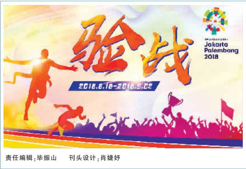
责任编辑:毕振山 刊头设计:肖婕妤