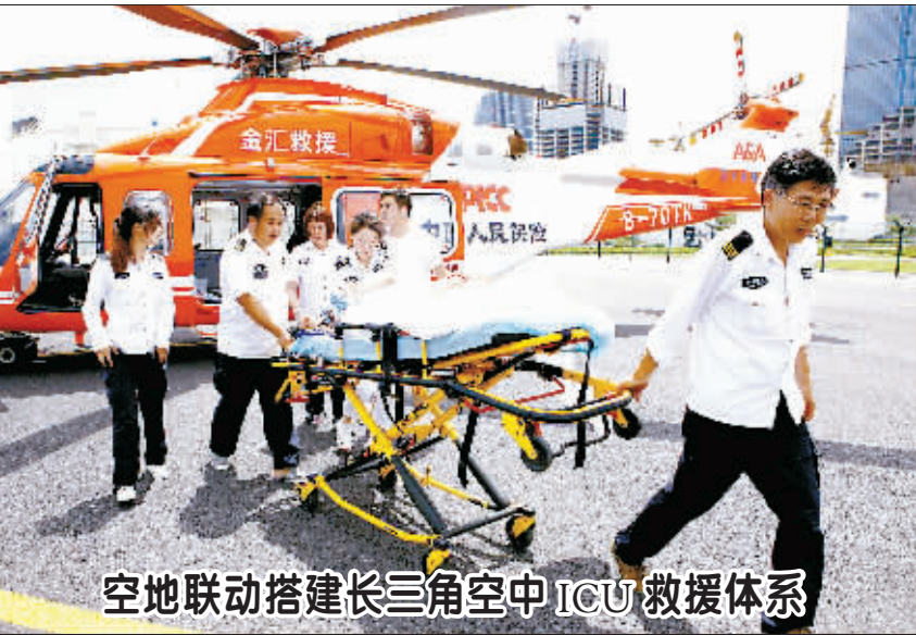
空地联动搭建长三角空中ICU救援体系

食品药品安全溯源、中小企业投融资、政府信用平台建设、金融行业、知识产权等领域进行试点,渝中半岛正在升级为重庆“链岛”。 “区块链技术作为新一代信息技术的重要代表,具有广阔的发展前景。我们要充分发挥区块链产业创新基地的先发优势,搭建全产业链条,加快应用落地,全力打造国家级区块链特色产业基地。”渝中区区长商奎对记者说,到2020年,该区力争打造2-5个区块链产业基地,引进和培育区块链国内细分领域龙头企业10家以上、有核心技术或成长型的区块链企业50家以上,引进和培育区块链中高级人才500名以上,将渝中建成全国“区块链之都”。