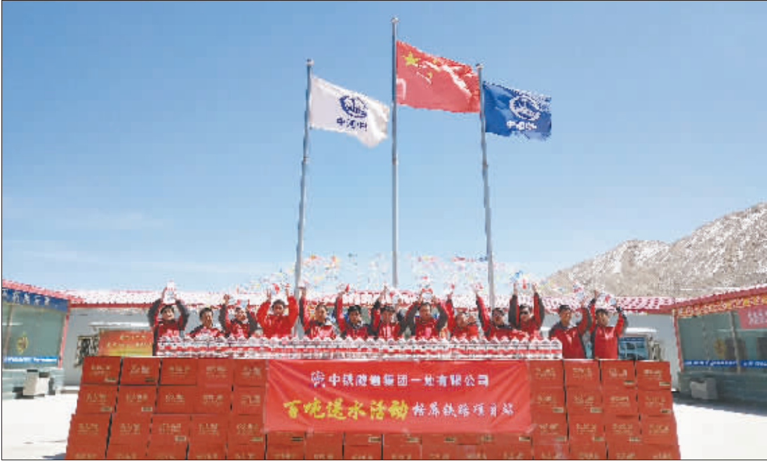
针对公司格库铁路项目饮水难实际情况,公司工会制定了3年“百吨送水”计划