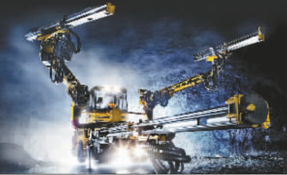
阿特拉斯三臂凿岩台车正在掌子面作业

中铁隧道一处工会相关负责人称,5年来,2人获全国交通基础设施重点工程劳动竞赛先进个人,5人获省部级重点工程劳动竞赛先进个人,2个项目荣获省部级“安康杯”劳动竞赛优胜单位,2个班组荣获优胜班组。