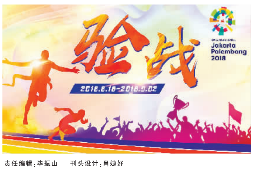
责任编辑:毕振山 刊头设计:肖婕妤