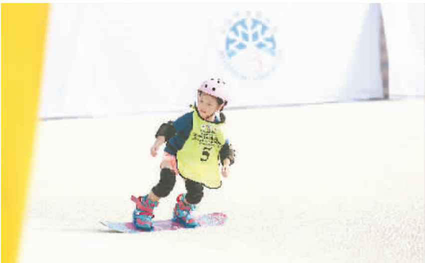
青少年组选手在北京奥森四季滑雪场上比赛。

2008年8月8日,中国人实现了百年奥运梦想。为了纪念北京奥运会成功举办,激发民众健身意识和热情,从2009年起,每年的8月8日被定为全民健身日。今年的8月8日是我国第10个全民健身日。近期,国家体育总局密集召开新闻发布会介绍我国在开展全民健身活动方面的成绩、问题,以及未来的规划。