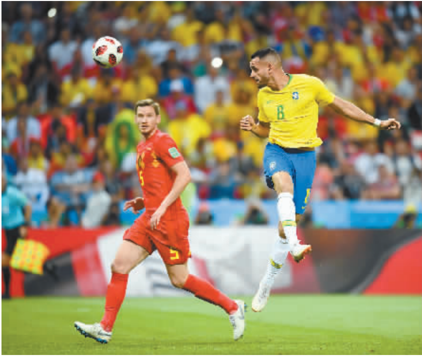
巴西国脚奥古斯托(右)对阵比利时队打进一球。

岛、瑞典,甚至是亚洲的日本都有令人耳目一新的表现。此外,赛前“最弱东道主”之称的俄罗斯打入8强,不被看好的克罗地亚一路杀入决赛,虽然未能战胜法国而捧杯,但已经创