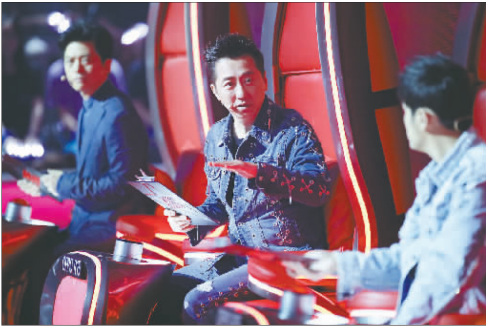
《中国好声音》再度回归。

而另一档央视自创自制的品牌音乐综艺节目《星光大道》,自2004年开播以来,坚持以“百姓舞台”为宗旨,力求为全国各地、各行业普通劳动者提供放声歌唱、展现自我的舞台,10多年来培养大批