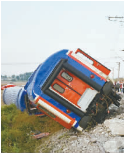
土耳其发生火车出轨事故

这是7月8日在土耳其泰基尔达省拍摄的火车出轨事故现场。 据土耳其卫生部门消息，土耳其西北部泰基尔达省8日下午发生火车出轨事故，目前已造成24人死亡。