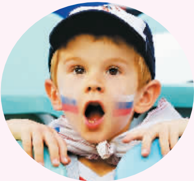
一名俄罗斯队球迷在开赛前。

际奥委会委员伊辛巴耶娃向塔斯社表示,“足球就是这样一项能团结所有人的运动,这就是动力和力量,而我们的球员们现在拥有了这样的能量。我坚信因为俄罗斯球员们在世界杯上的表现,将会让足球课充满青少年们的课余生活。”