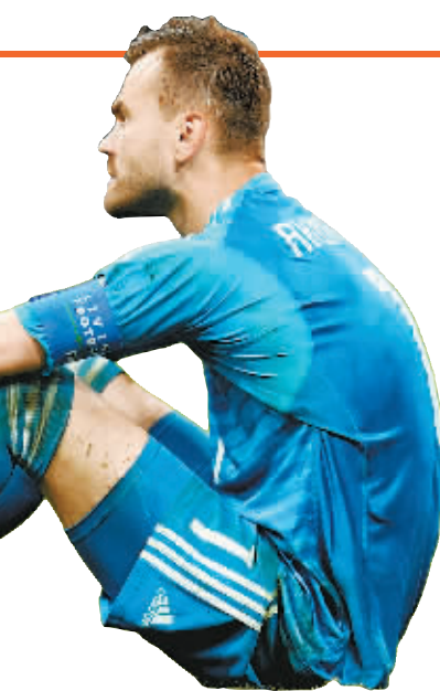
俄罗斯队门将阿金费耶夫失落的神情。

这会是非常困难的比赛。也许我一生只有一次踢世界杯半决赛的机会,我可不想演砸了。”