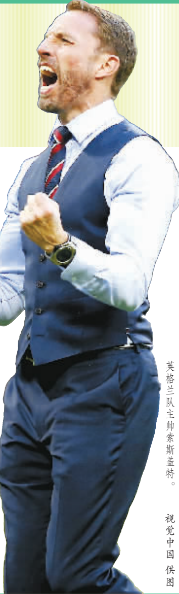
英格兰队主帅索斯盖特。

严格来说,克罗地亚队中的主力已不再年轻,但他们在俄罗斯的成功正是得益于多年来的努力与默契。30岁上下的莫德里奇、拉基蒂奇、曼朱基奇、佩里西奇等成名球星,终于在本届世界杯上迎来爆发。其实,新生代对于克罗地亚足球而言弥足珍贵。1998年,克罗地亚队正是在当年的“黄金一代”苏克、博班等人的带领下最终获得世界杯季军。这一次他们能更进一步取得突破吗?