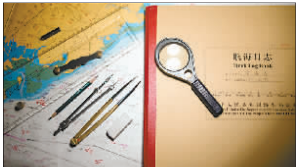
金海发货轮的航海日志。