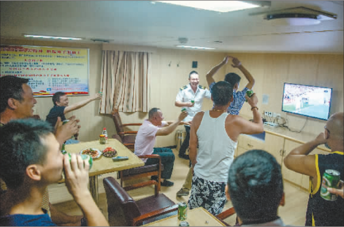
6月20日晚,世界杯小组赛葡萄牙对摩洛哥,没有当班的海员们聚在一起观看球赛。当C罗打进制胜一球时,海员们起身欢呼。