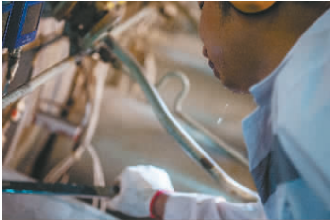
老轨对机舱的设备进行保养。机舱内空间狭窄,再加上机器运转时散发出的热量,这里的温度超过40摄氏度,轮机员们经常是满头大汗。