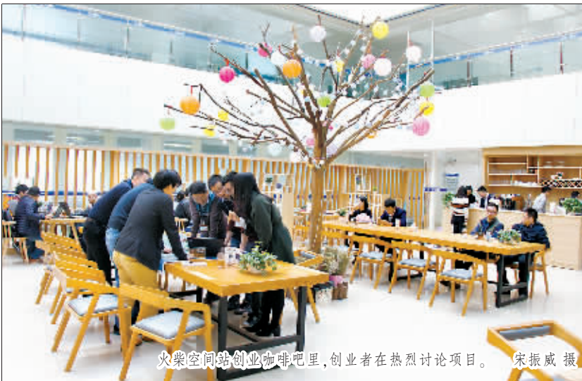
火柴空间站创业咖啡吧里，创业者在热烈讨论项目。

此外，中心正推行服务大厅升级改造。记者在服务大厅发现，综合窗口已在试运行，接下来将推动41个部门独立的专业窗口全部整合成综合窗口，实现“一窗受理”和“一网通办”。