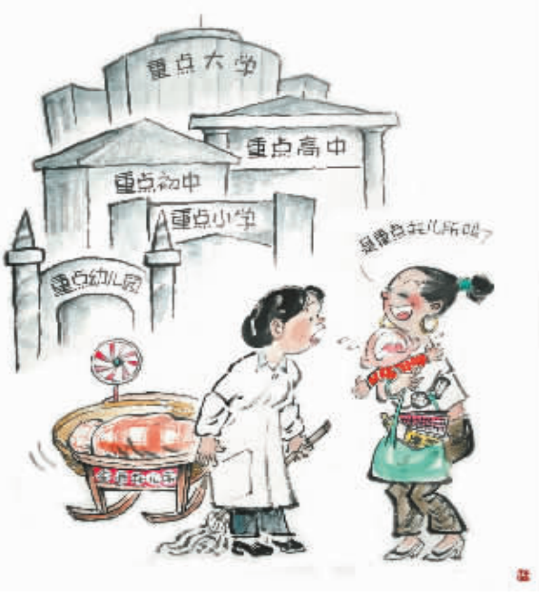
不能输在起跑线上