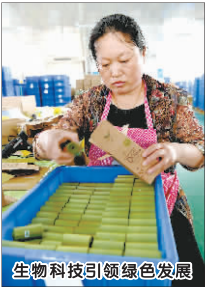
生物科技引领绿色发展

娱评人曾于里对此认为,此次会员制是在微博这样的大众平台推广,面向的受众更广,粉丝年龄更低。而大部分低龄化粉丝经济不独立,心理不够成熟,判断能力较弱,也容易受鼓动。作为公共平台,微博应该承担更多社会责任,而不是唯利是从,滥用平台权力,滥用明星影响力,对尚不成熟的粉丝经济推波助澜,想尽一切办法从低龄化粉丝口袋中掏钱。总之,粉丝付费模式本身没什么问题,但它不宜在大众平台上大肆渲染炒作,这很可能将粉丝经济导向狂热、盲从和非理性。