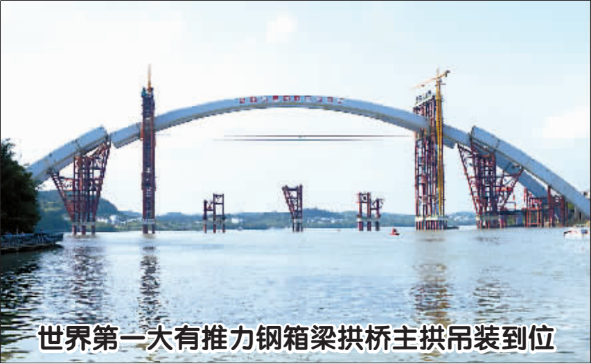
世界第一大有推力钢箱梁拱桥主拱吊装到位

会议指出,第一季度全国部分地区水环境质量不升反降,水污染防治工作短板突出,完成年度目标任务十分艰巨。