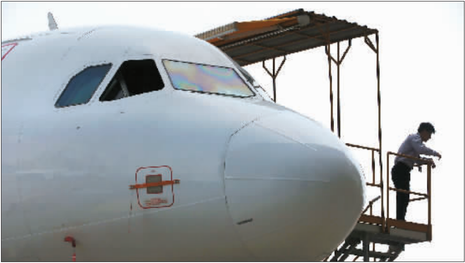
4月13日，厦门太古飞机工程有限公司，工人对一架飞机进行检修。