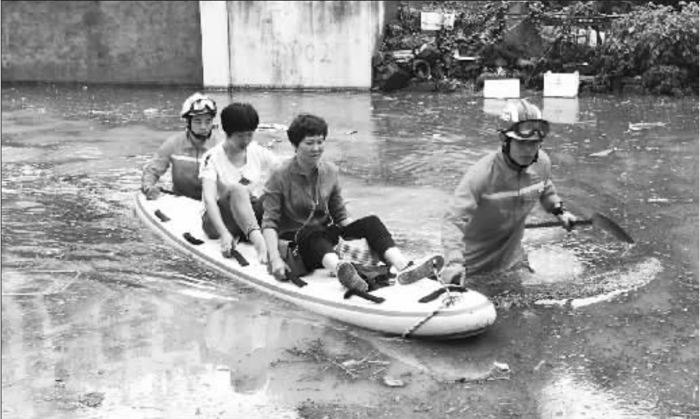
福建厦门遭遇特大暴雨