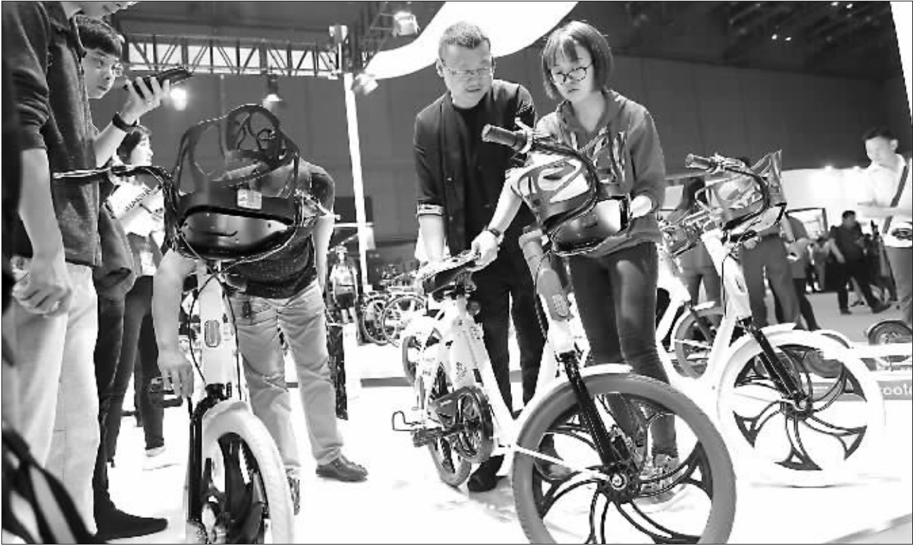
自行车企持续发力共享市场