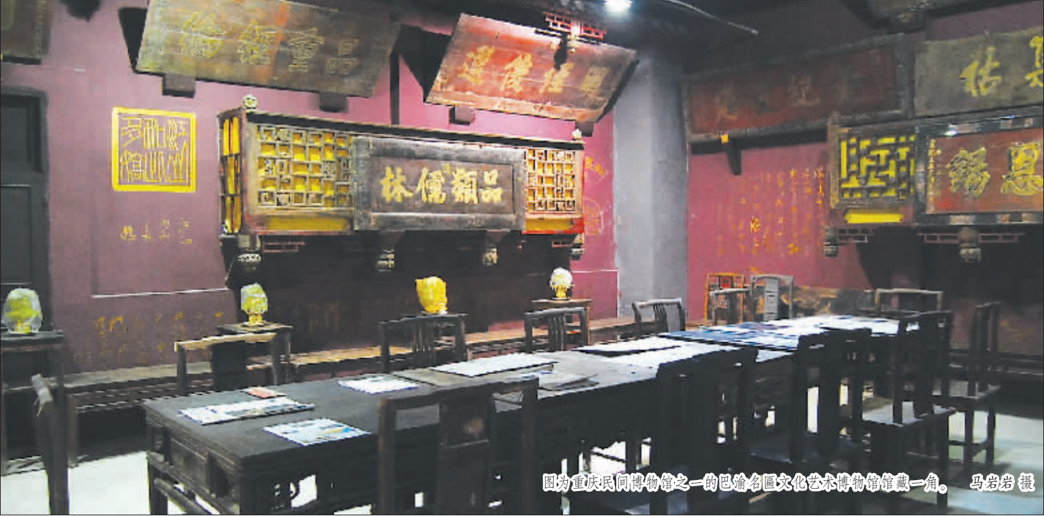
图为重庆民间博物馆之一的巴渝名匾文化艺术博物馆馆藏一角。

此前不久,民间博物馆进入公众视野,源于一篇名为《少年Ma的奇幻历史漂流之旅》的文章。作者将在河北冀宝斋民间博物馆的游览见闻,在博文里娓娓道来,引发热议。 因为这篇博文,网友将关注的目光重新投向民间博物馆,也记住了“冀宝斋”的名号。当然,是记住了骂名。这座民间博物馆的众多藏品令作者“大开眼界”,也“惊叹不已”。博文字里行间处处可见吐槽语句。事实上,更早些时候,著名收藏家马未都曾在博文中点评过冀宝斋——“这家博物馆藏品多,国家博物馆的汉陶说唱俑,他那里是银的;宋代五大名窑他有四个展柜;直径1.7米釉里红元代大盘,能颠覆中国陶瓷史……” 在中国各个城市,民间博物馆已成为一道风景。一些城市甚至把这些带着浓郁私人化标签的地方列为旅游热门地。 比如,成都市大邑县的建川博物馆,就是一座有名的民间博物馆。每天都有游客来此参观。再比如,有着“中国民间博物馆之乡”美誉的昆山锦溪古镇,曾被沈从文喻为“睡梦中的少女”,最多时曾聚集10多座各式各样民间博物馆。据不完全统计,截至2018年3月,中国现有博物馆4826座,民间博物馆仅占10%左右。 虽然数量不少,但近几年,不少民间博物馆越来越不受关注。人们更愿意将旅行目的地设为那些名声更响的大型博物馆。所以,当民间博物馆因为冀宝斋的出现回到人们视野中时,其回归未免也带几分“黑色幽默”。 最终,这篇引发争议的文章让冀宝斋得到的是“撤消注册证,闭馆整顿”的下场。