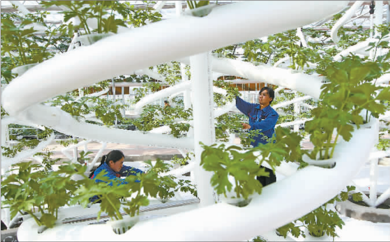
现代农业铺就乡村致富路 5月6日,河北省邯郸市肥乡区三江农业产业园的工人在管理无土栽培蔬菜。 近年来,肥乡区积极调整农业产业结构,通过引进农业产业化龙头企业,打造集观光休 闲旅游、农技研发推广、农产品生产等于一体的现代农业示范园30余家,有效推动农业增效和农民增收。

(上接第1版) 收购股股10元一公斤,高于全国平均收购价2至3倍;收购金银花40元一公斤,高于全国平均价4至5倍……刘渠波收购村民采摘的茶叶、野生绞股蓝、野生金银花,为了让村民们直接参与利润共享,向大家开出了远高于市场的收购价格。“不为别的,就是想让村民们的腰包鼓起来,更好地开启新生活。”刘渠波说,他最高兴看到的,就是村民们用茶叶换取收入后脸上泛起的笑容。 随着“5·12”汶川地震10周年的日子越来越近,涌入这里的人流也越来越多。5月初的下午,记者在“茶洋子”体验了映秀镇里的平常日子:清风徐来,人们品尝着浓郁的茶香。他们中有外来的客人,有短暂休憩的环卫工人,有镇上带小孩玩耍的阿婆……或许从未谋面,也不影响相互间的寒暄问候。 迎来花开时节 在汶川地震漩口中学遗址,以教学楼废墟前硕大的地震纪念表盘为背景,78岁的王太华与5位同村老伙计合影留念。 “忆往昔,看今朝,新映秀真的很美好!”老人感叹道,“灾难真的过去了,看到这里一切都好,心里感到特别劲儿!” “我们没去过什么地方,但映秀是一次筹划很久的旅行。”王太华一行从成都浦江