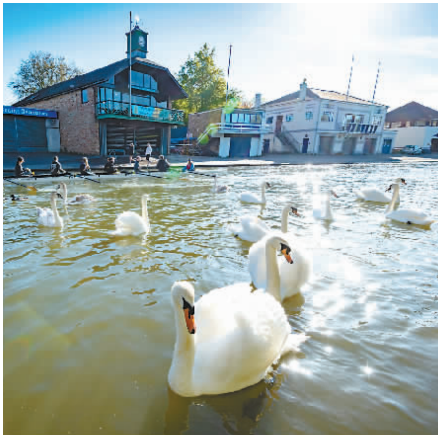
当地时间5月1日，英国剑桥仲夏公园，天气转暖，天鹅在水面畅游