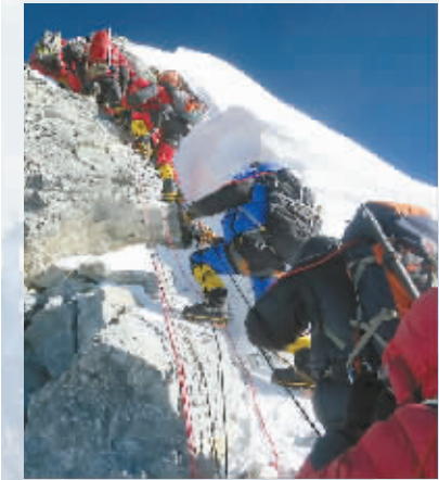
2013年5月18日，在距离珠穆朗玛峰顶仅10几米远的“希拉里台阶”处发生“拥堵”。

热闹到拥挤的珠峰，在带来可观经济收益的同时，也引发了很多必须得到正视的问题。作为有据可查的登顶珠峰第一人，埃德蒙·希拉里曾在自己的晚年表示，“我不希望那里变得商业味道十足，”他甚至自责地说，“是我帮助（他们）开启了这扇门。” 尽管统计数据显示，登顶珠峰的死亡率已经从上世纪90年代的5.6%降到了近年的1.5%，但有专业登山家指出，这些数据会令登山新手们对攀登珠峰这项极限运动产生一种“虚假的安全感”。事实上，即使商业登山服务降低了登山挑战的门槛，但攀登珠峰仍然是一项极具危险性的极限运动，高速商业化进程可能会掩盖其潜在的危险性。