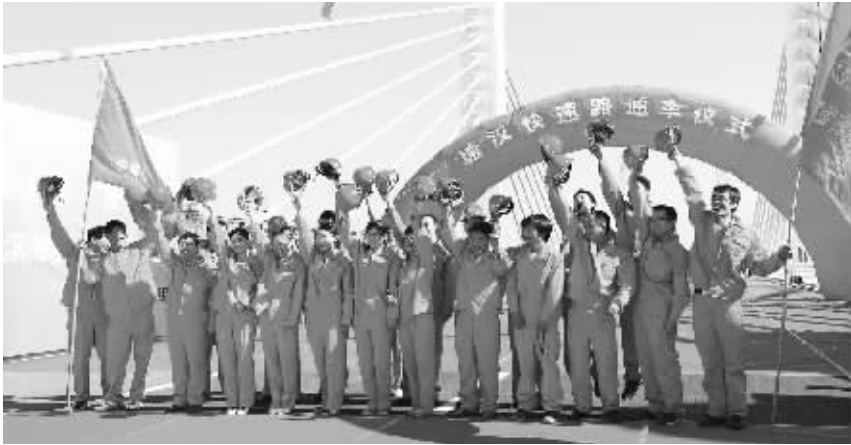
塘汉快速路工程劳动和技能竞赛。