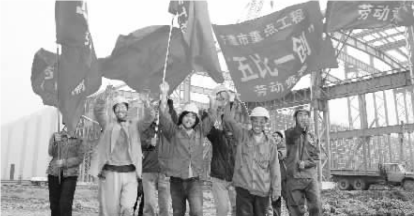
天津市重点工程项目参建农民工积极投身“五比一创”劳动和技能竞赛活动。