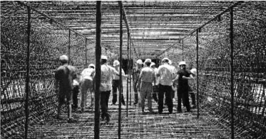
安徽省铁路重点工程劳动和技能竞赛现场。