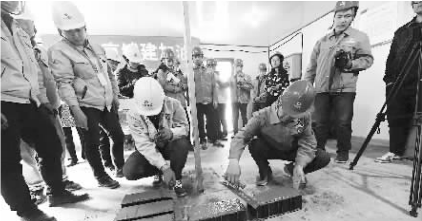
北京城市副中心建设劳动和技能竞赛现场。