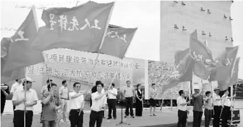
沪通长江大桥劳动和技能竞赛推进大会。

走过二十载,进入新时代,筑梦中国的新征程中,重大工程劳动和技能竞赛必将更好地引领广大建设者谱写新时代的劳动者之歌。