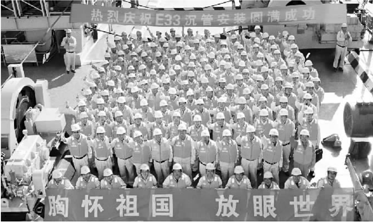
港珠澳大桥劳动和技能竞赛有力助推工程建设。