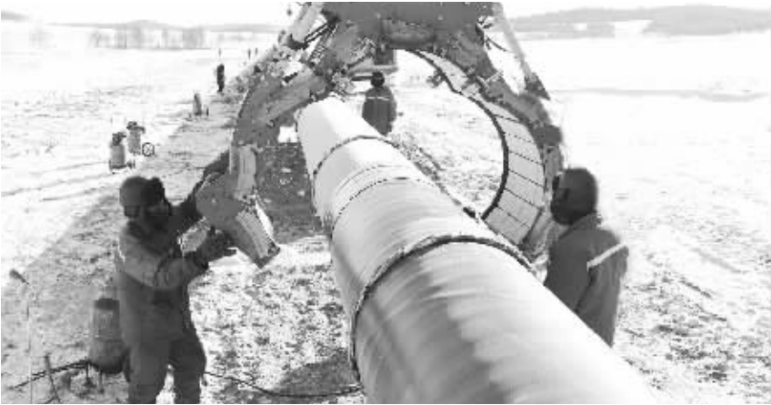
中俄原油管道二线工程建设劳动和技能竞赛——防腐补口机械化施工。