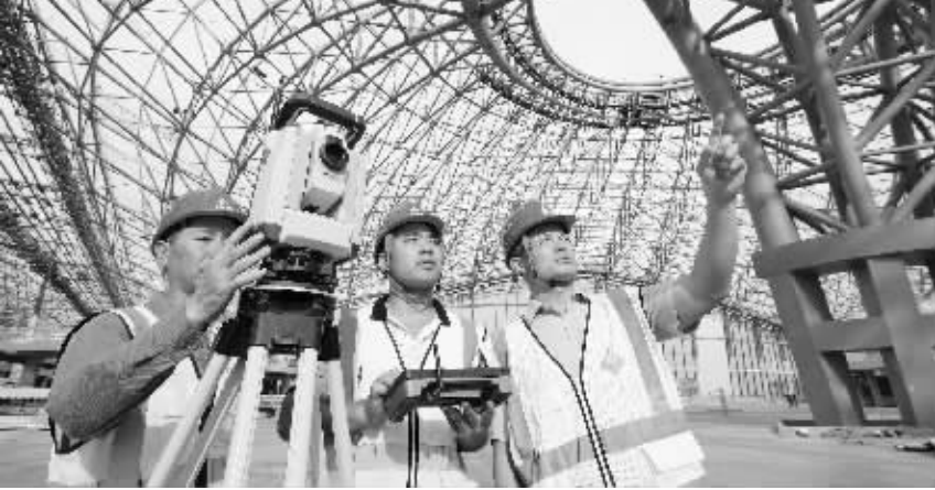
北京首都新机场建设劳动和技能竞赛现场。