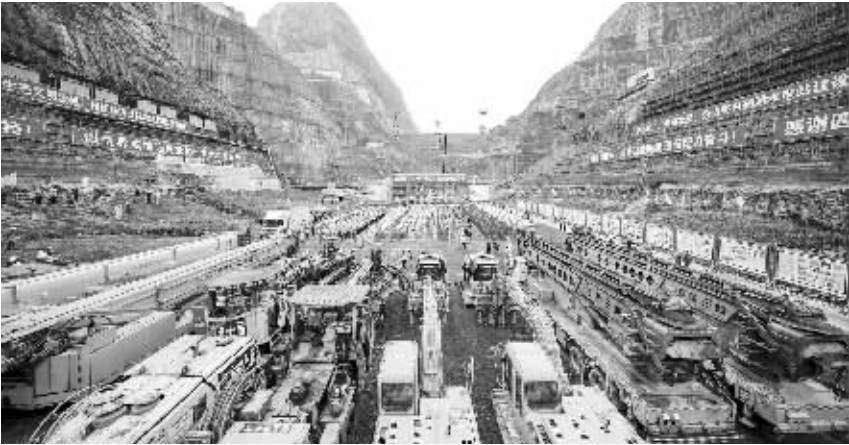
金沙江流域白鹤滩水电建设劳动和技能竞赛现场。