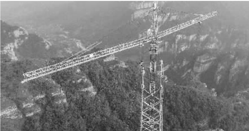
榆横—潍坊特高压交流输电线路工程(河北段)。