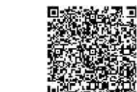
更多精彩内容 请扫描二维码

在电影场景里,有核设施反应堆出现,总是最扣人心弦、最令人紧张的部分,但在安娜看来,这不过是稀松平常的事——戴上头帽、棉纱手套,穿上连体服、白布鞋,一身普通的防护,就能进入反应堆。作为专业人员,她知道,只要一切严格按照流程走,其实这里的工作很安全。