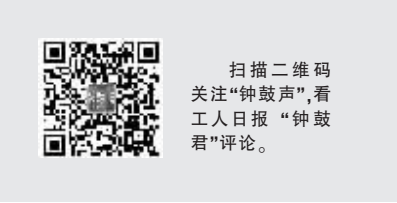
扫描二维码 关注“钟鼓声”,看 工人日报“钟鼓 君”评论。

推进行业集体协商,顶层制度设计还须更给力,需要各地继续探索更多有效的新路径,同时进一步完善相关法律法规等,以促进行业集体协商进一步蓬勃发展。