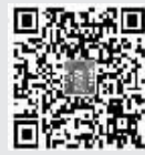
扫描二维码 关注“钟鼓楼”,看工人日报“钟鼓楼”评论。

越来越多的“人将人娱乐阵地从现实搬到互联网世界,这不只是空间的腾挪,而是以海量、即时、互动等先进体验为代表的文化生活方式的改变。十九大报告中“加强互联网内容建设,建立网络综合治理体系,营造清朗的网络空间”的要求,体现了“一手抓繁荣,一手抓管理”的网络建设思路。严把内容关口,让互联网文化空间多些精华,远离糟粕,网络文化市场才会有健康清新、向上向善的环境,也才会有高质量的繁荣。