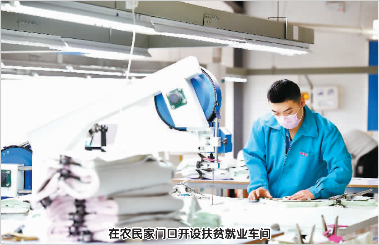
在农民家门口开设扶贫就业车间

在河南省台前县清水河乡清东村的一个扶贫就业车间,村民在制衣(4月1日报)。2016年开始,国家级贫困县台前县积极探索产业扶贫新模式,在农民家门口开设扶贫就业车间。截至目前,按照“一乡一业、一村一品”的思路,台前县新建和改扩建精准扶贫就业基地124个,共吸纳8090人就业,其中贫困群众3562人。