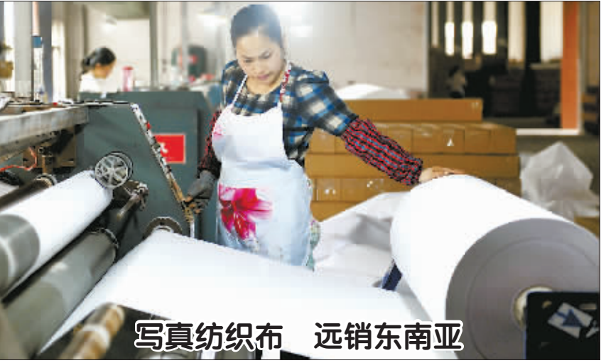
写真纺织布 远销东南亚

上海市人社局表示,在调整最低工资标准时,主要考虑城镇低收入家庭基本生活费用支出、城镇居民消费价格指数、职工平均工资、经济发展水平、企业人工成本等因素,既尽最大可能增强低收入劳动者的获得感,又充分考虑当前经济环境下企业的承受能力,兼顾了企业和劳动者双方的利益。