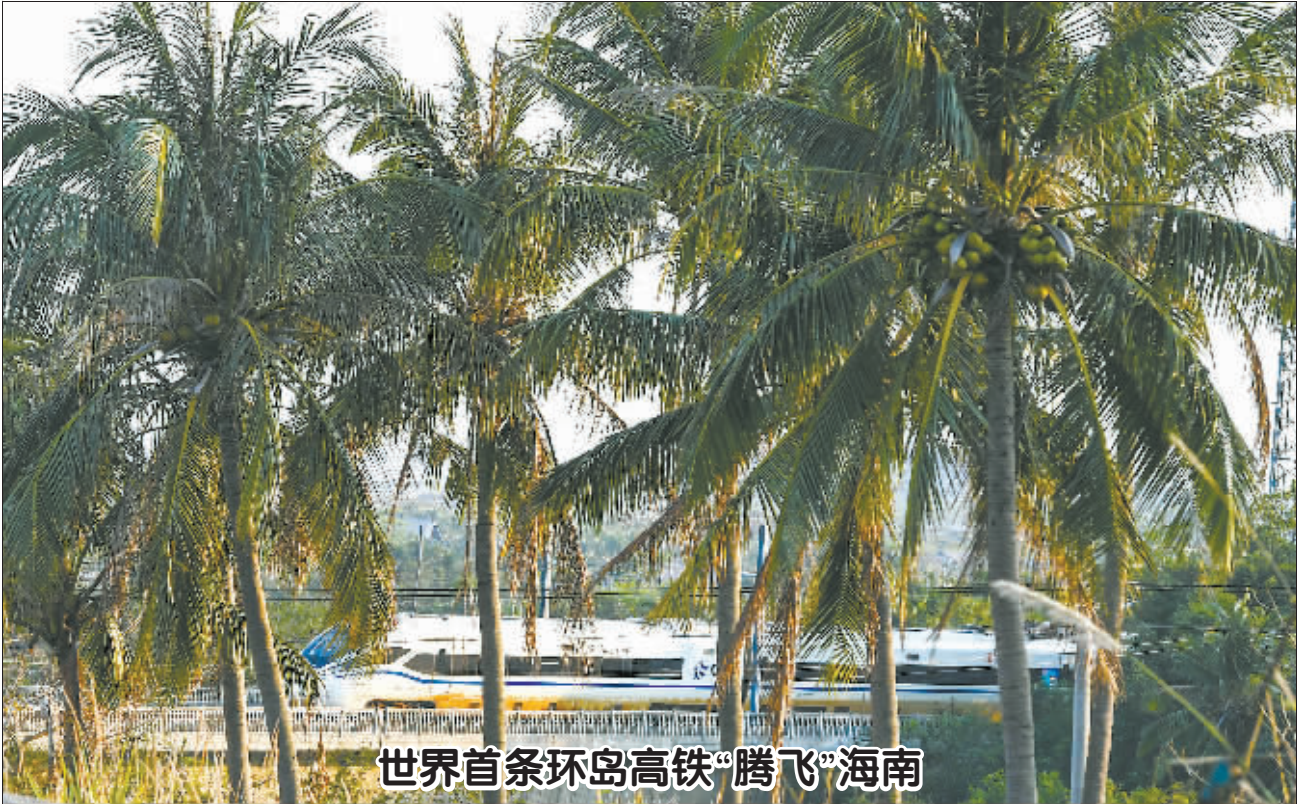
世界首条环岛高铁——海南环岛高

铁以旅游轴线为骨架,将海南几乎所有著名景点和重要城市串联起来,全长653公里,于2015年12月30日实现全线贯通,2017年旅客发送总量突破2500万人次。