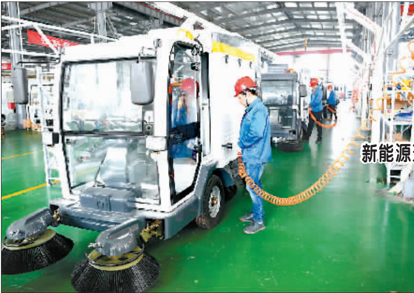
新能源环卫装备助力美丽乡村建设

据悉,我国的商事制度改革也引发国际舆论的较高评价。从2013到2017年度,我国营商环境的世界排名提高了18位,其中开办企业便利度上升了65位。