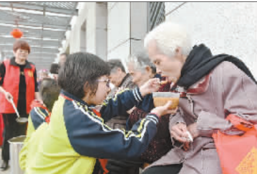
农历正月二十九“拗九节”是福州民间传统孝亲节。当地云峰中心小学学生为老人端上象征长寿的“拗九粥”。

据长沙晚报 作为第19届湖南文物国际博览会的重要活动,“民间收藏家向国有博物馆捐赠文物仪式”3月14日在湖南省文物总店举行。据悉,此次活动是湖南民间收藏家首次集中无偿捐赠。 本次捐赠文物共121件,包括战国陶制礼器、汉代铁质农具、唐代长沙窑瓷器、醴陵窑瓷器以及传统木工工具等,由湖南省文物总店、胡劲松、卢运全、李天然、陈湘舟等单位和个人无偿捐赠。株洲市博物馆、湘潭市博物馆、隆平水稻博物馆接受捐赠。据悉,捐赠文物具有鲜明楚文化特色。由湖南省文物总店捐赠的战国彩绘陶敦、器型仿青铜器式样,由两个半球形器合成球状,为古代食器。敦与鼎、壶等组成一套陪葬礼器,在战国时楚地较为流行。捐赠给隆平水稻博物馆的几件文物与水稻关系密切。湘潭市博物馆此次受赠文物中包括斧头、曲尺、墨斗、锯子、刨子、凿子、钻子等108件传统木工工具。湖南省文物局副局长江文辉表示,民间捐赠是博物馆收藏的重要补充,是博物馆赖以生存和发展的源泉,也是衡量博物馆社会影响力的重要标准之一。 (王瑜 编辑整理)