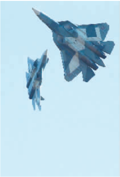
苏-57战斗机