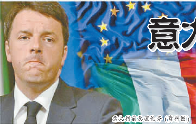
意大利前总理伦齐(资料图)