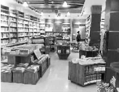
▲ 琳琅满目的书店里,几乎没有顾客。

相比之下,书店却显得很冷清。同日下午3时,位于两村庄之间的新华书店,仅有两人在阅读。在记者蹲守的两个小时内,除了两个前来歇脚的游客外,几乎再无人进出,对周围种类多样的图书毫无兴趣。中国政法大学知识产权研究中心特约研究员李俊慧建议,加强农村文化娱乐健身等设施的投入,以满足乡村的文化娱乐需要。