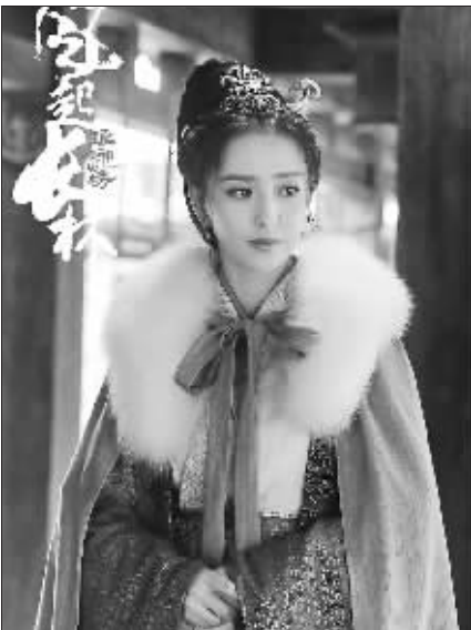
《琅琊榜之风起长林》剧照

“《大秦帝国之崛起》里,秦王秦人的奋发有为、开拓进取精神也对当下中华文化的伟大复兴提供了积极有益的历史镜鉴及文化价值。”谈到历史正剧强势回归,中国传媒大学影视学院教授戴清评论道。 “影视剧理应成为文化传播的先锋,‘一带一路’又为中国影视剧海外推广提供了新的机遇,2017年出现的一批网台联播的新古装历史题材电视剧,兼顾题材类型和剧情等搭配,展现中国的历史、传统文化,其中浓厚的中国元素令海外观众耳目一新。”对于这两年间涌现出的一批历史题材影视剧,华侨大学新闻与传播学院讲师孙婕认为,在国际文化传播及传统文化复兴的共同需求下,历史题材影视剧大受欢迎,这是强有力的文化信号。在“一带一路”发展背景下,古装历史题材影视剧创作前景大有可为。 “目前海外观众看到的仍主要是CNN和BBC的故事,但他们对中国形象的渲染并不真实。”国家广电总局国际司司长马黎指出,“一定要把最优秀、最有价值的作品向国外推广。” “现在的历史剧有很多新的拍摄方法,比如增加了大量现代生活伦理,将人物漫画卡通化,赋予人物强烈的现代个性、增加了喜剧元素和黑色幽默等效果,这些元素都在构造出新的历史文化,使得现代古装题材影视剧不但能吸引国内观众,还能以此传播出当下中国式的价值理念和行为方式,旧瓶装新酒,对于打造‘中国故事热’也会大有助益。”孙婕说。