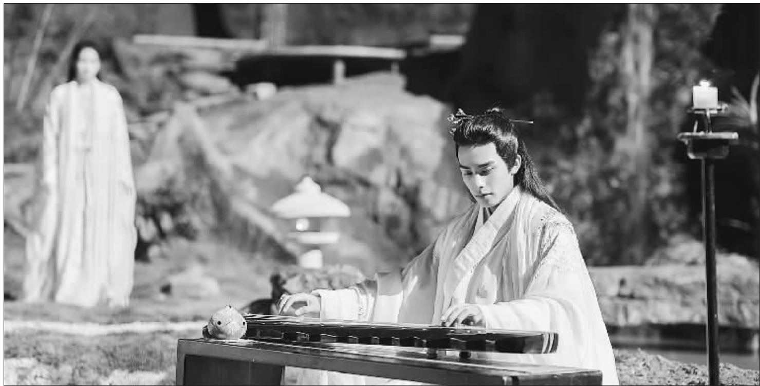
电视剧《凤囚凰》正在热播。