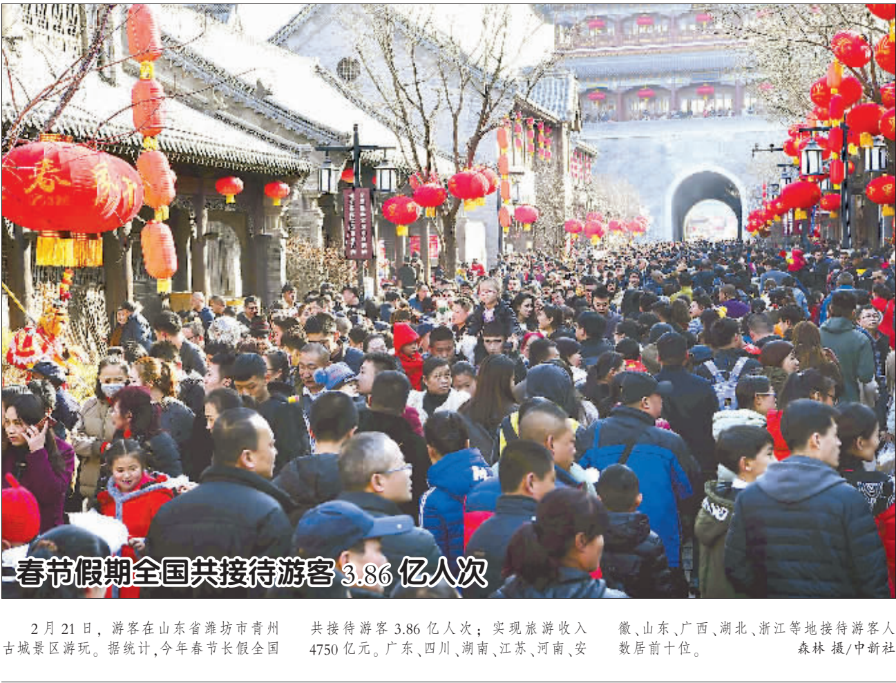
—春节假期全国共接待游客 3.86 亿人次

7 时 10 分,天刚放亮,昆明南站自助售票机前已有很多旅客光顾。 “我就说不用到窗口排队,你瞧,一副身份证证照就出来了,还不到一分钟!”旅客张若静高兴地向身旁的小伙伴说。自助售票机大幅减少旅客购票的时间,守住窗口排长队购票早已成为历史。春运期间,昆明南站的 90 台自助售票机每天发售的车票约占客流数的 65%。