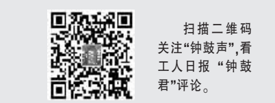
扫描二维码 关注“钟鼓声”,看工人日报“钟鼓君”评论。

春运,凝聚人情冷暖,承载集体记忆。某种意义上说,它是满足人民美好生活需求的一扇窗口,是映照改革成效的一面镜子。春运路上的那一一张张笑脸,洋溢着满足与幸福,也写满了对国家发展、社会进步、生活改善的享受与期待。