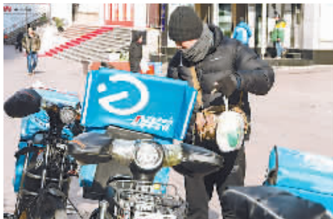
寒风中的外卖小哥。

是非常重要的生活目标。探探是一款基于LBS的陌生人社交应用,成立不到3年已经获得1.2亿美元融资,截至2017年7月份,其手机注册用户达到9000万,有效用户6000万。更早之前,陌生人交友应用陌陌在成立的3年间融资超3亿美元,最终于2014年12月11日在纳斯达克上市。