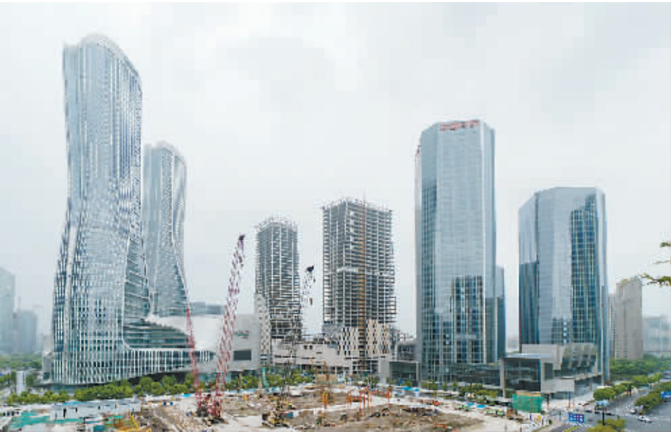
正在建设中的杭州钱江新城CBD。

根据2016年度统计数据测算,全省10个重点传统制造业用47%的工业用地,73%的能耗,85%的排放,43%的用工,贡献了43%的工业增加值和40%的税收,投入产出效益总体偏低,在亩均税收、