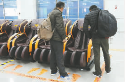
2017年11月7日,在北京地铁东直门站内出现了一排共享按摩椅,供路过的乘客按摩放松。

不过,有投资者认为,共享按摩椅虽然具备了完整的商业模式,也符合消费者休闲消费需求,但还处在一个起步阶段,行业还有很多需要规范和发展的地方。特别是共享按摩椅主要靠用户的基础付费来实现营收,未来要在附加价值上下功夫,深度挖掘潜在价值,为用户提供个性化的订制服务。