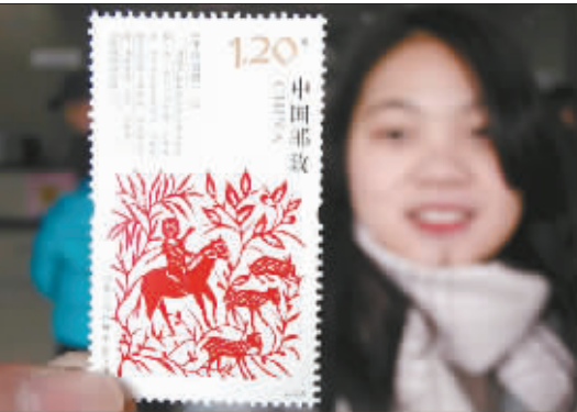
日前，一名集邮爱好者在江苏省苏州邮政局展示新发行的《中国剪纸（一）》特种邮票。

过去一年，艺术节已成为陕西职工们线上线下热议的话题。此次艺术节，陕西省总首次启用网络直播手段对演出进行现场直播。据统计，整场晚会在在线观看人数达到16.1万人次。 去年3月，陕西省职工文化艺术节网上作品报送展播平台正式上线。所有参评节目均通过网络进行报送。据平台数据显示，合唱、音乐、舞蹈、戏剧曲艺四大展演版块累计收到投票80万人次，浏览量达到近700多万人次。“网络展播、投票的方式，增加了职工文化艺术节在全省职工中的知晓率和参与感，也鼓励更多有想法有才艺的职工参加到艺术节中展示风采，使艺术节真正成为全省职工共享的文化盛宴。”陕西省总工会宣教部部长张朝惟说。 随着经济建设的快速发展，职工群众精神文化需求日益旺盛。如何突破传统方式，让职工文化建设形式更加丰富、参与更加广泛、内容更受欢迎？张仲茜表示，这是陕西省总一直在思考和探索的重要命题。为此，他们积极向陕西省委省政府建言献策，通过各种方式鼓励表彰为职工“代言”的艺术家，激发他们的创作活力。 “未来，我们还将继续组织艺术家到企业一线、到职工中体验生活，创作出更多反映新时代职工风采的艺术作品，让职工文化成为创造社会正能量的重要源泉。”张仲茜说。