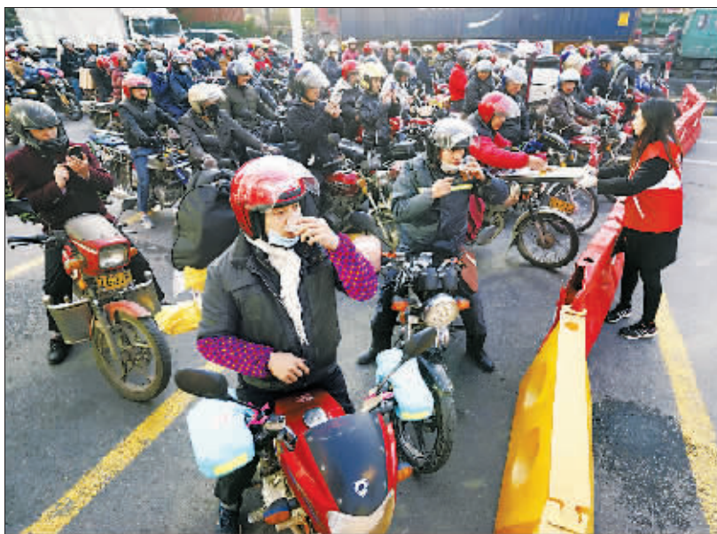
2月1日,春运首日,在广东佛山市,成千上万的“摩骑大军”从这一天开始陆续踏上返乡路。受经济、交通、安全意识等多种因素影响,摩骑大军的数量在逐年减少。